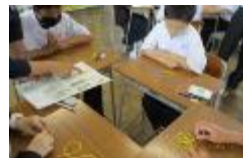
シトラスリボンづくり(学級)