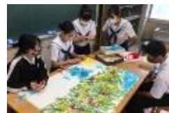
全生徒のリボンを1つに(生徒会)